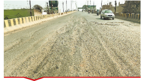
लाखदान की पलाई ओवरब्रिज खराब।

[बिल्हा | मस्तूरी | तखतपुर | मुंगेली | कोटा | लोरमी | सरगांव | पेंड़ा | बेलतरा | रतनपुर | पथरिया]