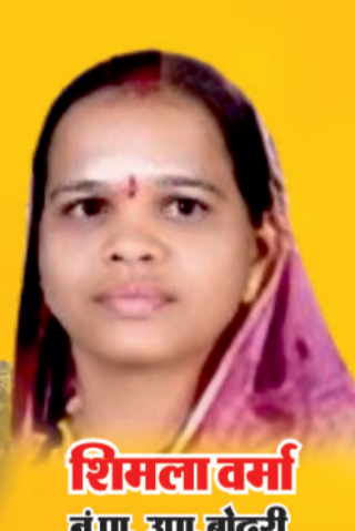
शिमला वर्मा नं.पा. उपा. बोदरी