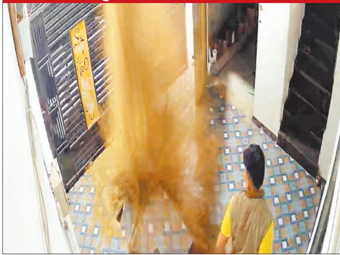
वह मकान जहां फर्श को तोड़कर घर में भरा पानी।